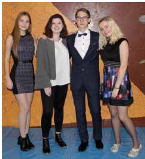
Suit Up Day