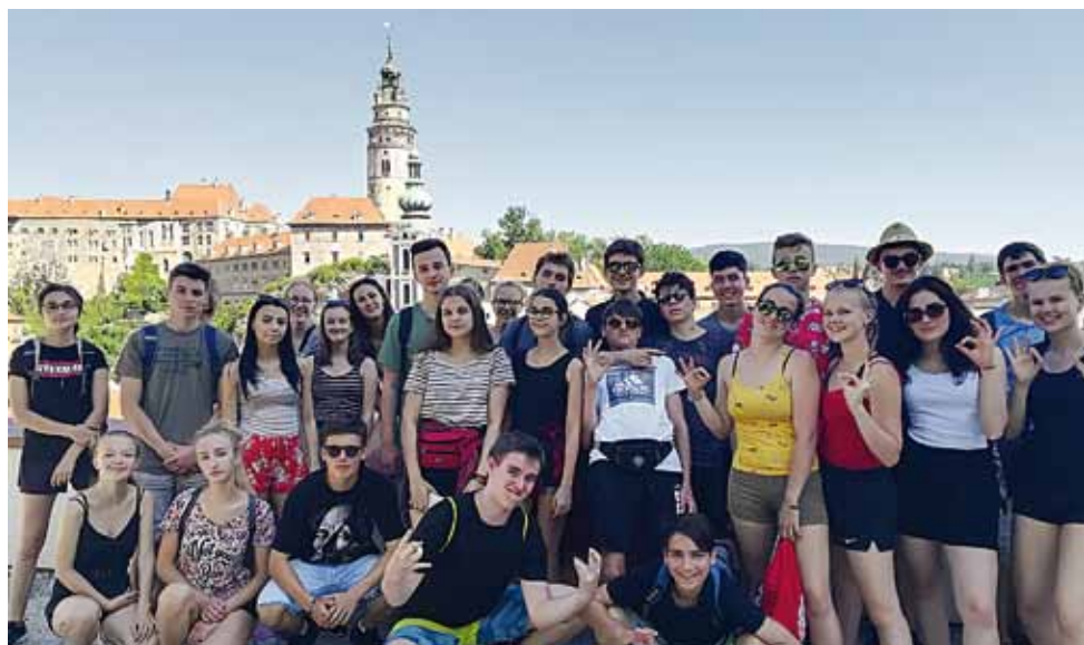
Školní výlet v Českém Krumlově