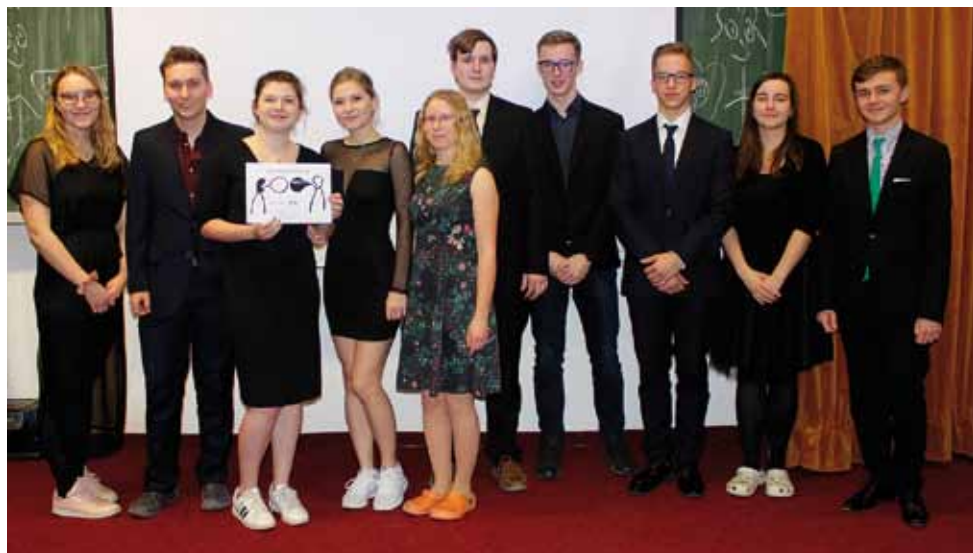
Z Debatní ligy