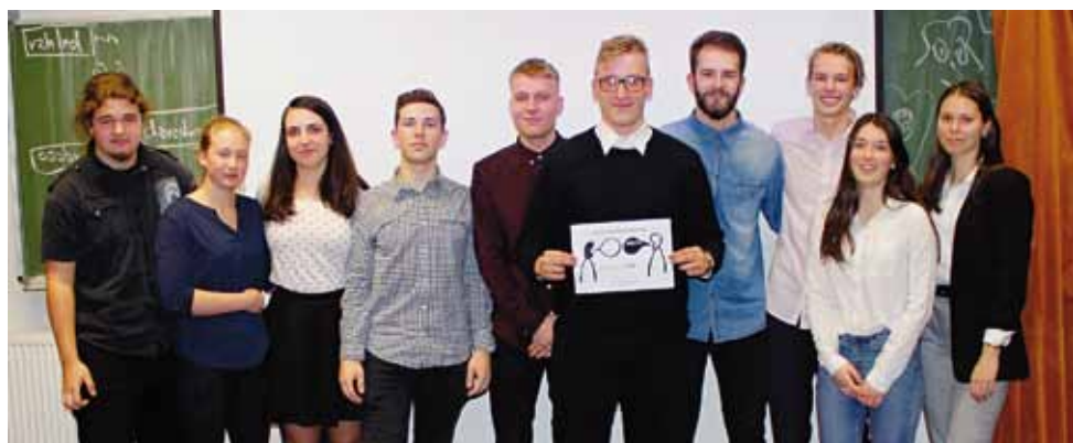
Z Debatní ligy