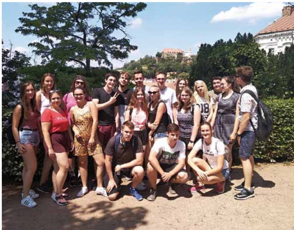
Třída C2A na školním výletě