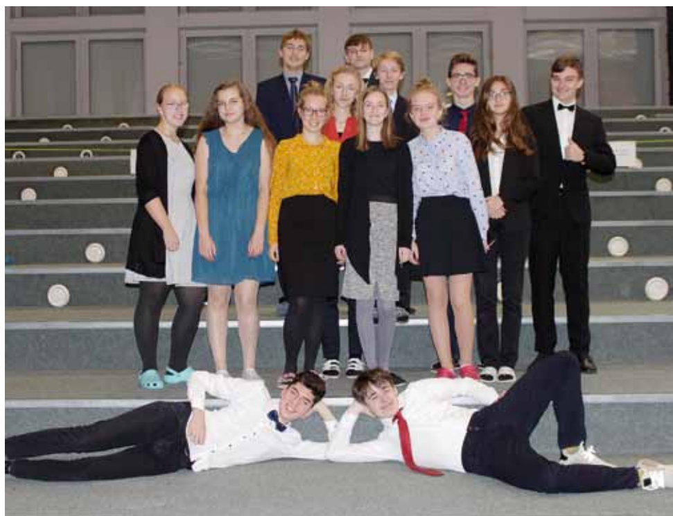
Suit Up Day