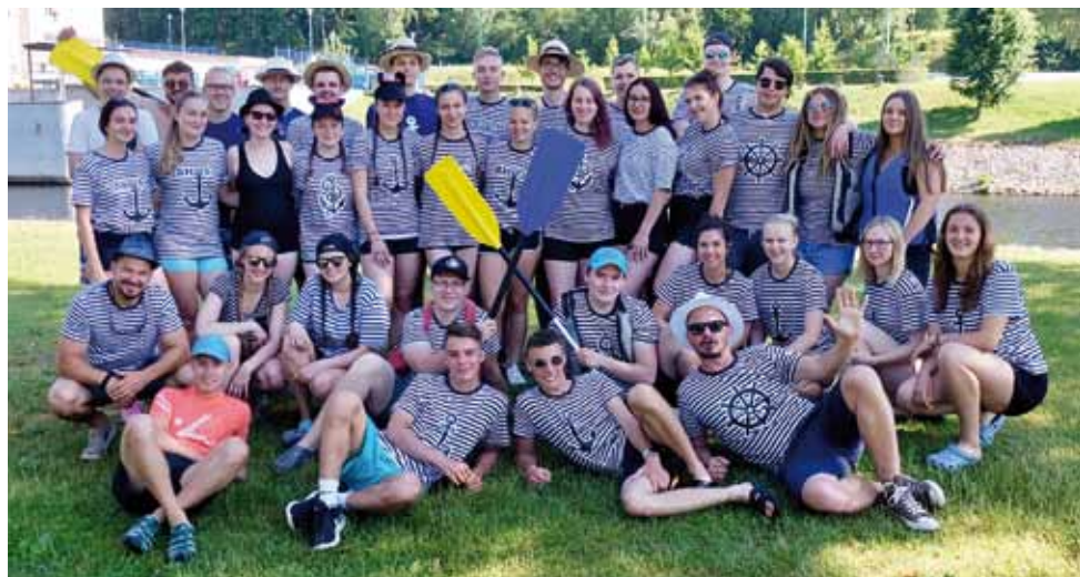
Vodácký kurz na Vltavě